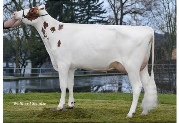
VOX SABINA RED

CAUDUMER SOLITAIR P RED ET X VOX SABINA RED (ABI RED ET) X VOX SOPHIA (STEP RED ET)