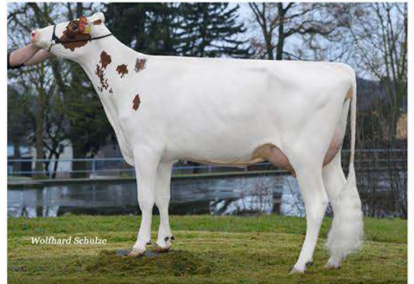
VOX SABINA RED

CAUDUMER SOLITAIR P RED ET X VOX SABINA RED (ABI RED ET) X VOX SOPHIA (STEP RED ET)