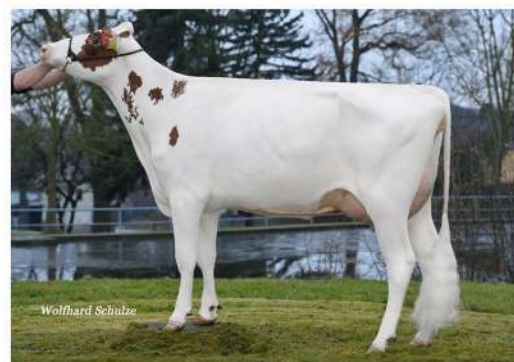
VOX SABINA RED