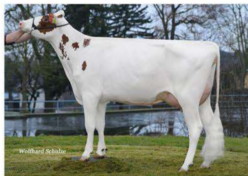
VOX SABINA RED

CAUDUMER SOLITAIR P RED ET X VOX SABINA RED (ABI RED ET) X VOX SOPHIA (STEP RED ET)