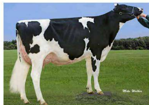
GREEN-BANKS CANDY ET

PEAK ALTAAMULET ET X GREEN-BANKS CANDY ET (MONTEREY) X SCO-LO-KRUSE CANDY ET EX90 (DEAN) X LARCREST CORALEE ET GP83 (GERARD)