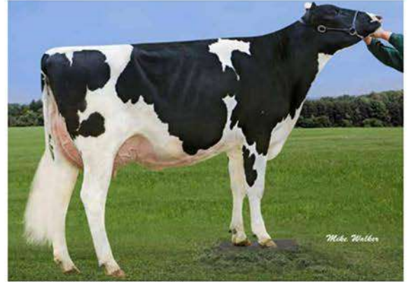
GREEN-BANKS CANDY ET

PEAK ALTAAMULET ET X GREEN-BANKS CANDY ET (MONTEREY) X SCO-LO-KRUSE CANDY ET EX90 (DEAN) X LARCREST CORALEE ET GP83 (GERARD)