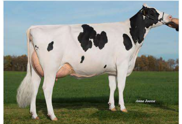
DG CANDIDE 8604 ET

S-S-I MONTROSS JEDI ET X CANDIDE 8604 ET (POWERBALL P) X DG CANDIDE ET (MOGUL) X LARCREST CALE ET VG89 EXMS (OBSERVER) X LARCREST CRIMSON ET EX94 96MS (RAMOS)