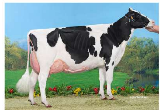
BTS SWANN ET