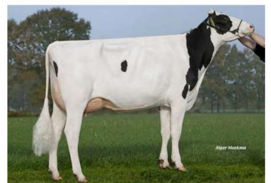
FG POLICY 1